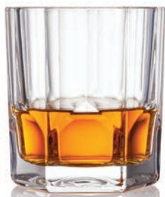
ANGOSTURA 1787 RUM